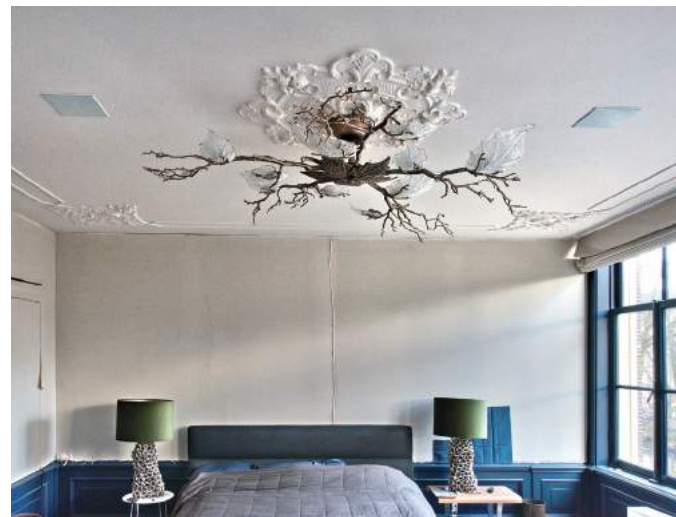
De plafondrestauratie is gereed, het wachten is nog op wandbekleding.